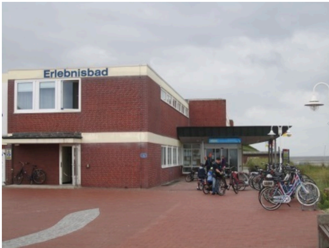
Meerwasser Erlebnisbad "Oase"