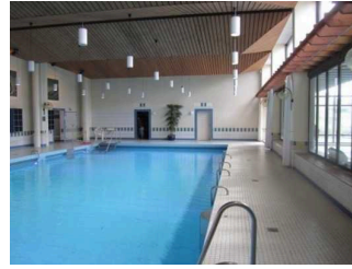
Meerwasser Erlebnisbad "Oase"