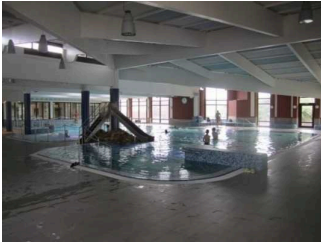
Meerwasser Erlebnisbad "Oase"